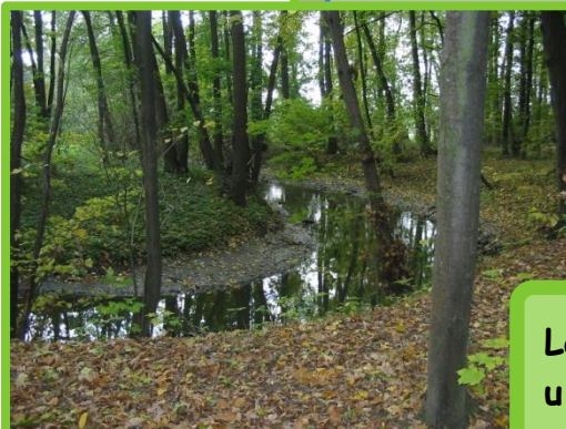
Lokalita č. 1: Břehové porosty u ramene řeky Moravy