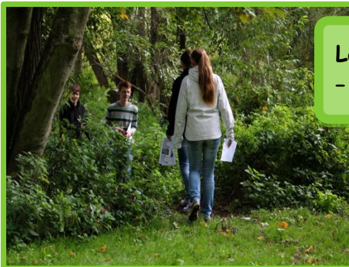
Lokalita č. 4: Břehový porost - hlavní tok Moravy