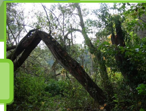
Lokalita č. 2: Lužní les - starší porost