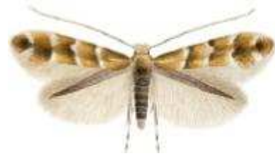
Obr.2: Klíněnka má rozpětí max. 1 cm

Možná jste zaregistrovali, že listy jírovce maďalu (kaštanů) začínají žloutnout nebo dokonce opadávat již na konci léta, nápadně dříve než většina ostatních listnatých stromů. Není to normální stav, ale jev způsobený nenápadným motýlkem klíněnkou jírovcovou.