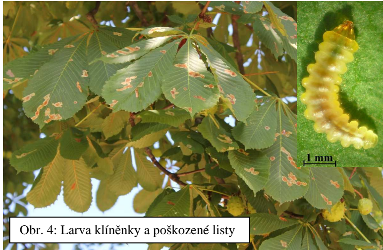
Obr. 4: Larva klíněnky a poškozené listy

Důsledky nejsou i při kalamitním výskytu dramatické, protože jírovce zatím přežívají. Během biologické vycházky na deseti pozorovaných listech z jednoho stromu spočítejte skvrny po larvách. Doplňte tabulku.