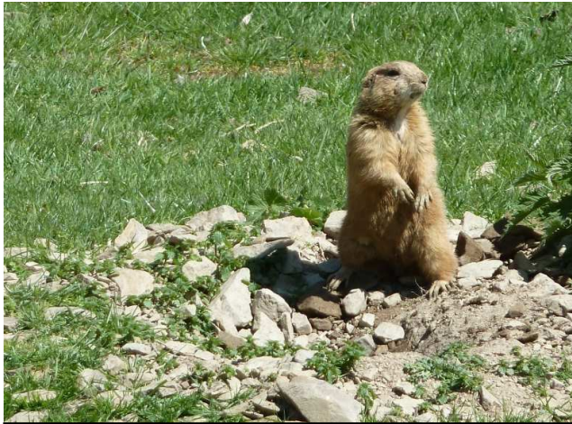
Psoun preriiový vev výběhu, který téměř odpovídá jeho přirozenému prostředí

V procesu chovu získávají ZOO mnoho poznatků, které jsou často zajímavé pro vysoké školy přírodovědného zaměření, pro zoologické ústavy a muzea. Velmi důležitou funkcí je osvětově vzdělávací činnost. ZOO se podílí na rozšiřování a osvojování biologických a ekologických znalostí nejen v průběhu školní výuky. Zajímavým trendem poslední doby je i chov domácích zvířat (farma, babiččín dvorek). Vzhledem k úbytku dříve běžně chovaných hospodářských zvířat, si děti na vlastní oči mohou prohlédnout a někdy i zažít kontakt se