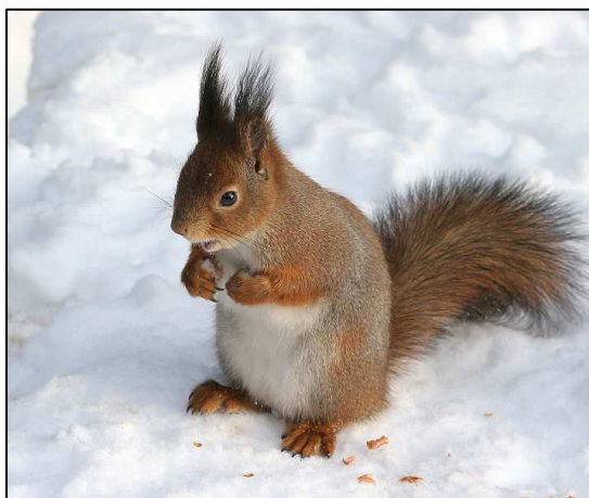
Obr. 1: Stopy veverky jsou typické rozdílným otiskem přední a zadní končetiny