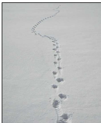
Obr. 2: U stop lze změřit i délku a šířku kroku zvířete