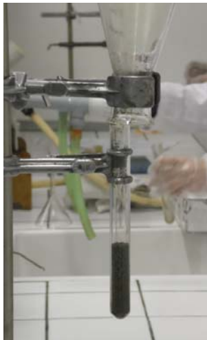
Foto: rozklad dichromanu amonného