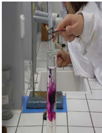
Foto: rozpouštění mangananu draselného ve vodě