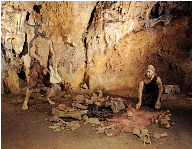
Obr 2. Nejvíce pozůstatků ze života pravěkých lidí se našlo v Dómu mrtvých , ve kterém je instalována tato scenerie.

Již ve 20. letech 20. století tak bylo známo, že se jedná o pozůstatky člověka moderního typu, latinky ..... Sídliště v Mladečských jeskyních přitom patřilo k nejstarším nalezištím pozůstatků těchto lidí, tzv. .... kultury. Stáří kostí bylo určeno pomocí analýzy hmotnostní spektrometrie, a to na přibližně ..... tisíc let. Zjištěné údaje vedly k závěru, že Mladečské sídliště sloužilo nejstarší prokázané populaci člověka moderního typu ve střední Evropě.