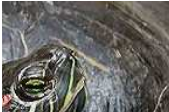
D Obr. 4