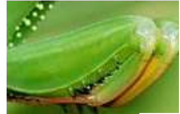
C Obr. 3