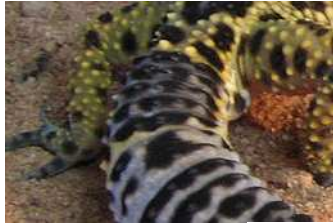
A Obr. 1

Na obrázcích jsou části těla známých druhů chovaných zvířat. Dokážeš určit, o které zvíře nebo taxon se jedná?