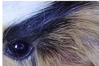
E Obr. 5