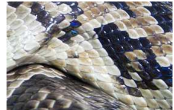
F Obr. 6